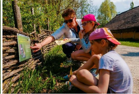
Educatie; de bijenspeurtocht in Archeon, initiatief en foto Jan van der Kooij