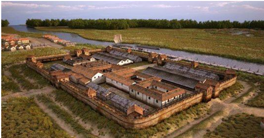
Een castellum langs de Oude Rijn

Uitgaande van oude landschapselementen en nieuwe mogelijkheden die beschreven zullen worden in het onderzoeksrapport van de Helpdesk (WUR) zal vanaf 2021 met externe stakeholders een plan van aanpak geschreven en uitgevoerd worden. Hierbij zal rekening gehouden worden met het oude Limes en veenlandschap uit de Romeinse Tijd en andere historische landschapselementen in dit gebied.