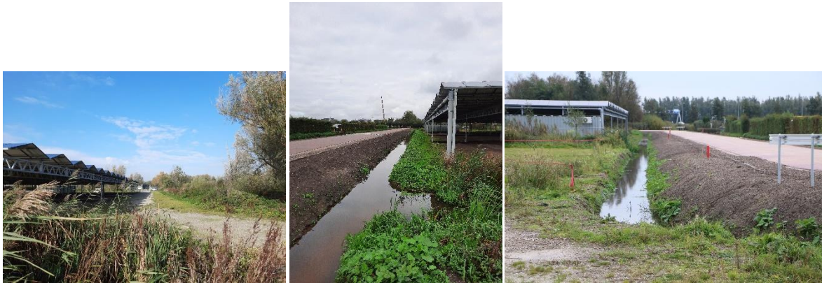
het terrein met sloot en de zonnepanelendak

Het traject van deze 2 e ontsluitingsweg is in overleg met de gemeente en Archeon tot stand gekomen. Op dit moment is deze nieuwe parkeerplaats nog niet in gebruik, de locatie heeft de kenmerken van een bedrijventerrein. Er bestaat een onveilige en onwenselijke situatie omdat het makkelijk is om over de sloot te springen en op het zonnepanelendak te klimmen. Zie onderstaande middelste foto.