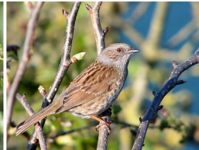
bloei en bes van de sleedoorn met zandbij en mus (Wikimedia)