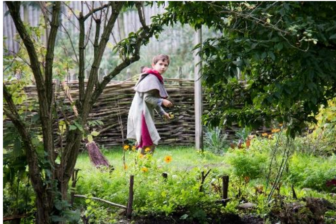
Bloemen in de middeleeuwse tuin

echter aan modes onderhevig. Parken als de hiervoor genoemde weten dat, en moeten vernieuwen om hun bezoekers te behouden. Interessant is dat we trends kunnen onderscheiden die de toeristisch recreatieve beleving van de vroege 21e eeuw kenschetsen. Initiatieven in Alphen kunnen van deze trends gebruik maken om hun activiteiten 'toekomstproof' te maken.