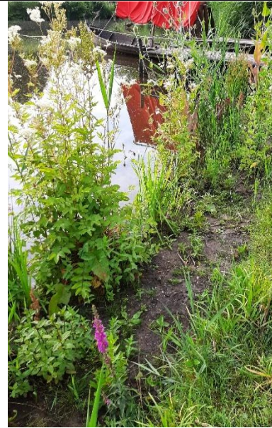
10 juli, Vikingtijd, oever.