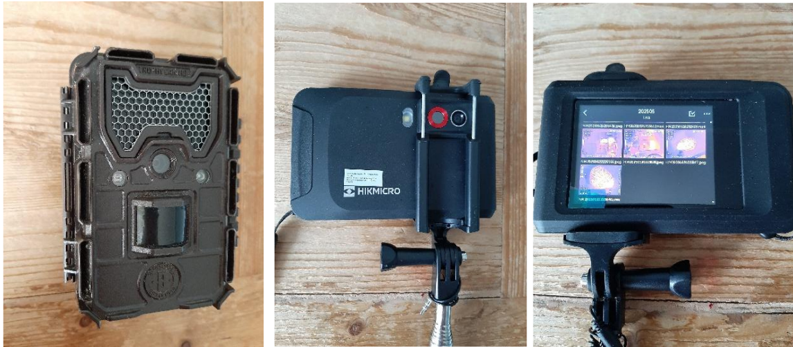
Fig. 2 Cameraval (links) en warmtebeeldcamera (midden en rechts)