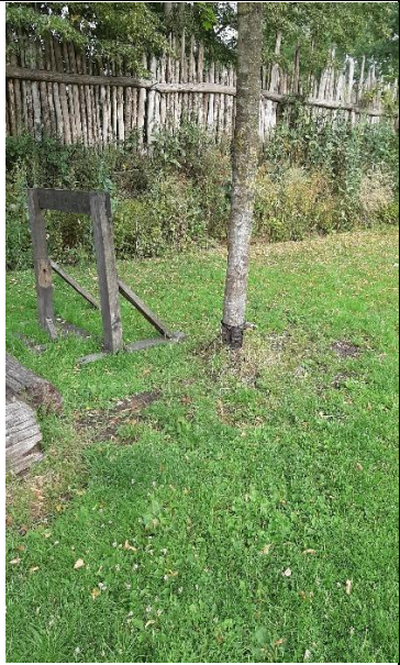
9 juli, Vikingtijd. Bevestiging cameraval.