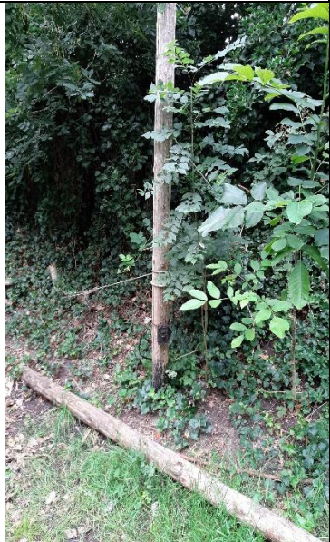
29 juli, Schuttersveld. Bevestiging cameraval.