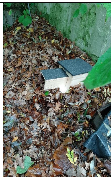
18 nov - 31 dec, muurtje Romeinse schrijfschool. Voerhuisje boven.