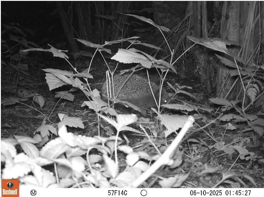
Fig. 3 Foto gemaakt met de cameraval achter de Bronstijd boerderij