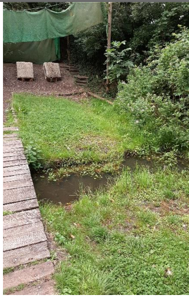
29 juli, Schuttersveld, oever.