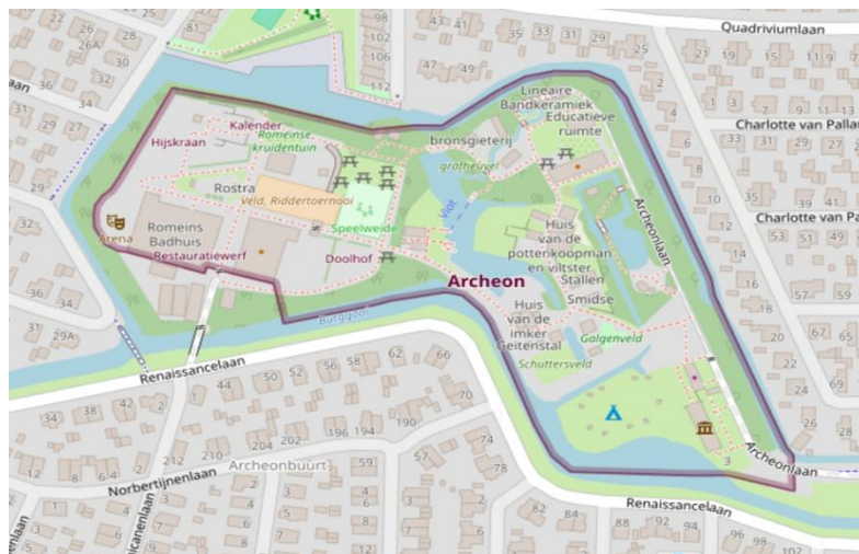
Fig. 1 Ligging van het Museumpark Archeon

De bebouwing bestaat uit reconstructies van historische gebouwen (boerderijen, huizen en hutten) uit de prehistorie, de Romeinse tijd en de middeleeuwen (Museumpark Archeon, 2025).