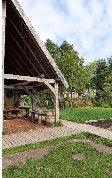
9 juli, Vikingtijd. Grasvelden.