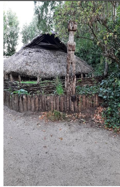
25 aug, IJzertijd pad. Bevestiging cameraval.