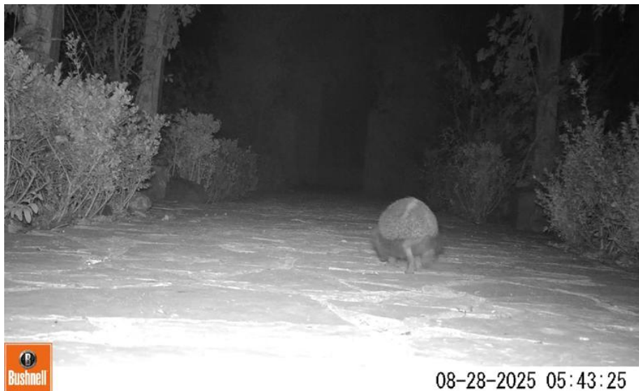
Fig. 5 Egel met speekselspoor op de rug, gezien in het Romeinse tuintje

volwassen dieren. Tenslotte is het geslacht van een dier soms van het camerabeeld af te lezen. Bij mannetjes kan de penis zichtbaar zijn.