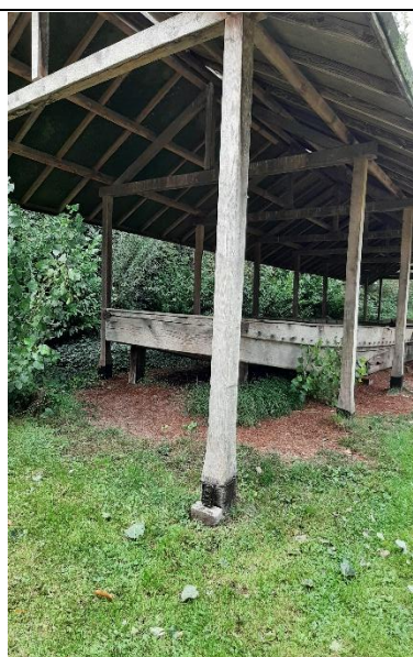
18 sept, Romeins vrachtschip. Bevestiging cameraval.