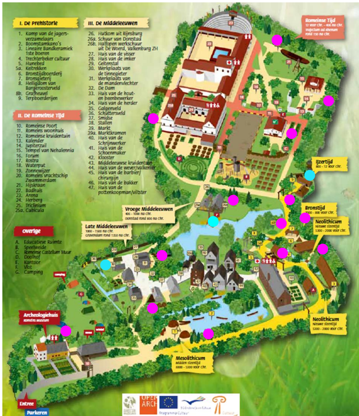
Fig. 6 Locaties waar egels gevonden zijn: ●. Wel cameraval geplaatst maar geen egels waargenomen: ●.

In onderstaande plattegrond, fig.6, is te zien in welke biotopen er egels gevonden zijn.