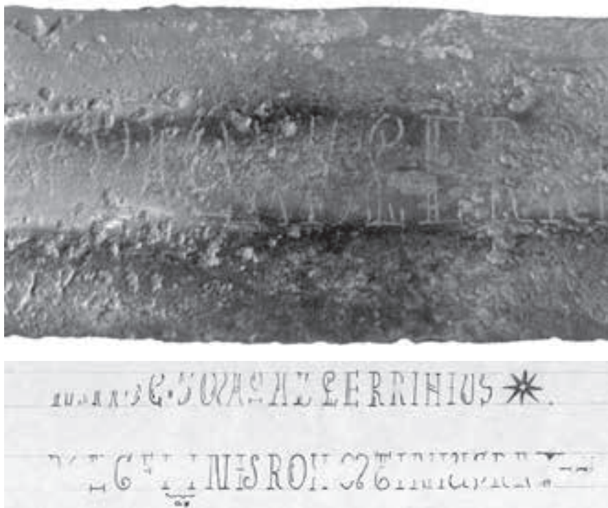
AFB. 2 Foto van een deel van een zwaard uit Berlijn, W 1830. Tekening van de inscriptie door A. Holst Blennow. Berlijn, Deutsches Historisches Museum.

De letters zijn zeer regelmatig en volgen de lijn van de bloedgeul in het zwaard. Ze lopen taps toe, van ca. 15 mm aan het begin van de tekst (dichtbij het gevest) tot ca. 12 mm. aan het einde. Nog een aanwijzing voor de kwaliteit van de inscriptie is het feit dat hij aan beide zijden van het zwaard even lang is: ca. 285 mm. De kruisen waarmee de tekst begint en eindigt staan aan weerszijden van het zwaard op exact dezelfde plek. Hoewel de vorm van het zwaard niet meer precies te herleiden is door ontbreken van het gevest en corrosie richting de punt, kan toch geconcludeerd worden dat het om een zeer kostbaar wapen gaat. Niet alleen het materiaal wijst op een wapen van hoge kwaliteit, de zorg en vaardigheid waarmee de inscriptie is ingelegd onderstrepen dit.