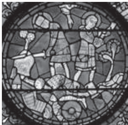
AFB. 4 Roeland probeert zijn zwaard Durandal op een rots te breken. Glasraam in de kathedraal van Chartres.

Vooraf een passage uit het de dertiende-eeuwse Middelnederlandse vertaling van het elfde-eeuwse Roelandslied spreekt