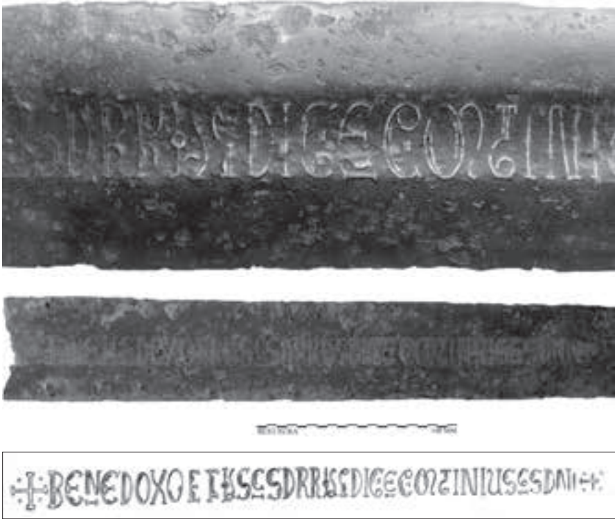
AFB. 1 Het Alphense zwaard: het ongeconserveerde zwaardblad, het geconserveerde blad en een transcriptie van de inscriptie.

deerd. 5 Een enkele publicatie over de categorisering van zwaarden met inscripties daargelaten, is er weinig inhoudelijk onderzoek naar deze bijzondere vondst gedaan.